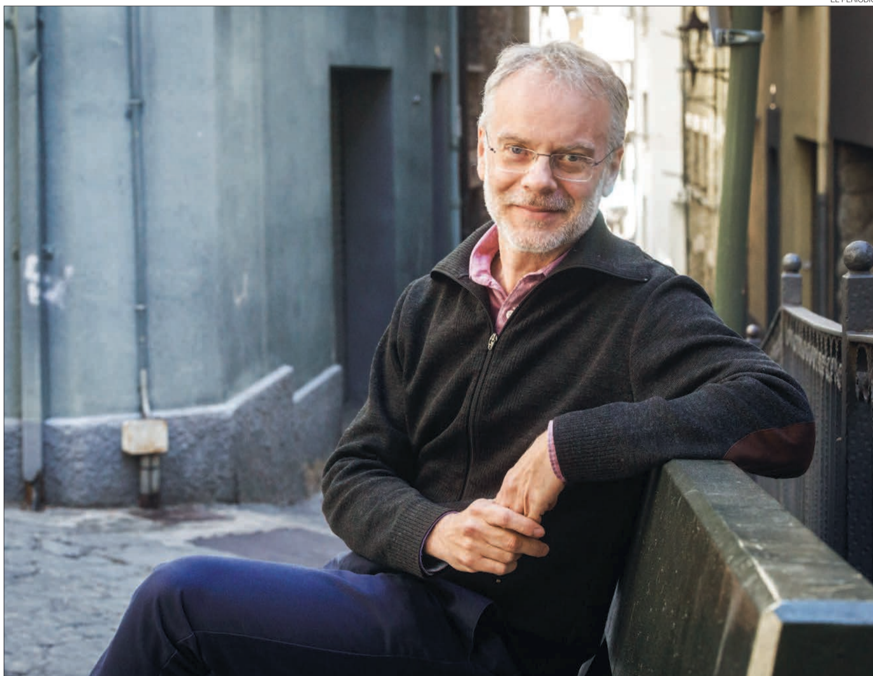
► El cap de la llista nacional de Progressistes-SDP, Josep Roig, atén a EL PERIÒDIC al centre històric d'Andorra la Vella.

–Establir un topall del 15% en l'augment de les rendes en les renovacions dels contractes d'arrendament i garantir un sistema de prestacions