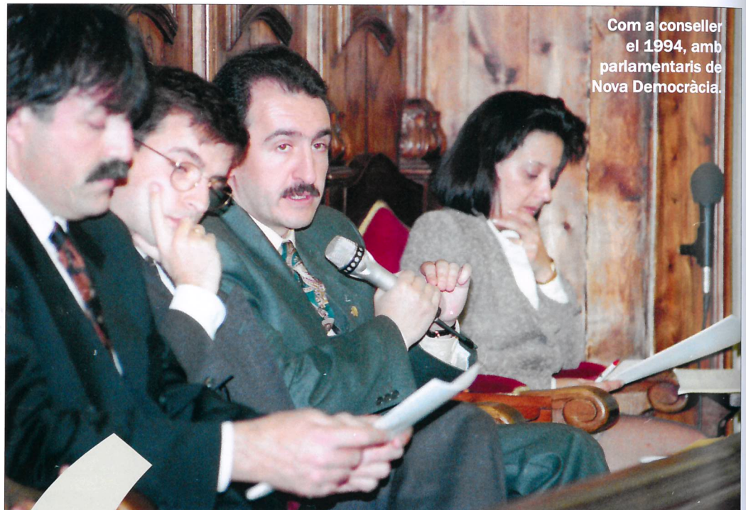
Com a conseller el 1994, amb parlamentaris de Nova Democràcia.

Sense la Constitució, Andorra no hauria aguantat diverses embranzides internacionals, com la qüestió de la llista negra de paradisos fiscals, el fet d'haver homologat l'activitat financera, d'anar cap a la transparència, de començar amb l'intercanvi d'informació fiscal a la demanda l'any 2009... o la gestió de la crisi d'una entitat financera el 2015, sense l'acord monetari que vam negociar el 2010 i que es va signar el 2011 amb la UE, tampoc s'hauria suportat. I evidentment sense la Constitució no es podien negociar aquestes qüestions, perquè calia passar per la via constitucional i ser un Estat reconegut per la comunitat internacional.