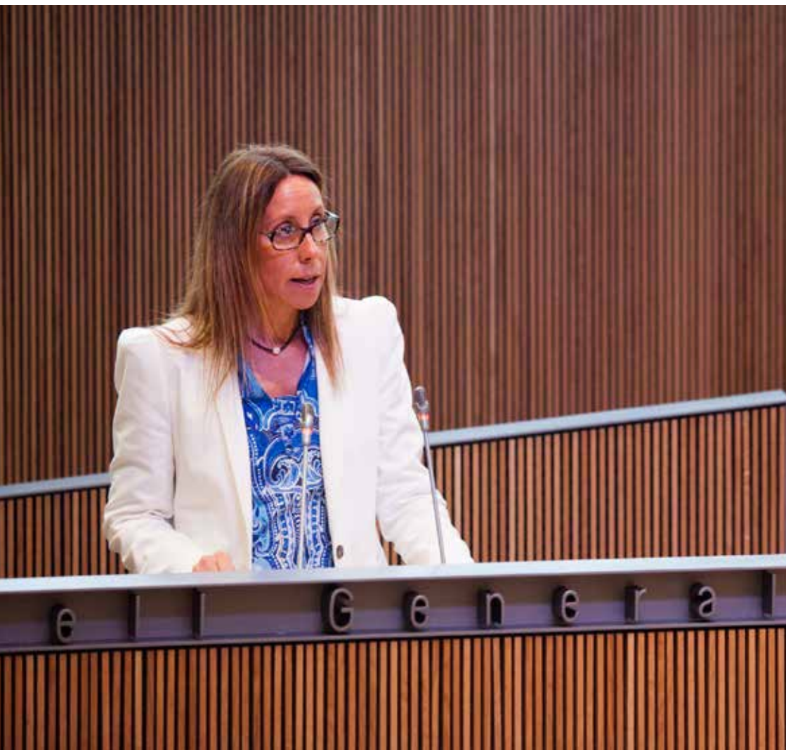
La consellera general Sílvia Bonet, durant la seva intervenció en el debat d'orientació política juny del 2014.