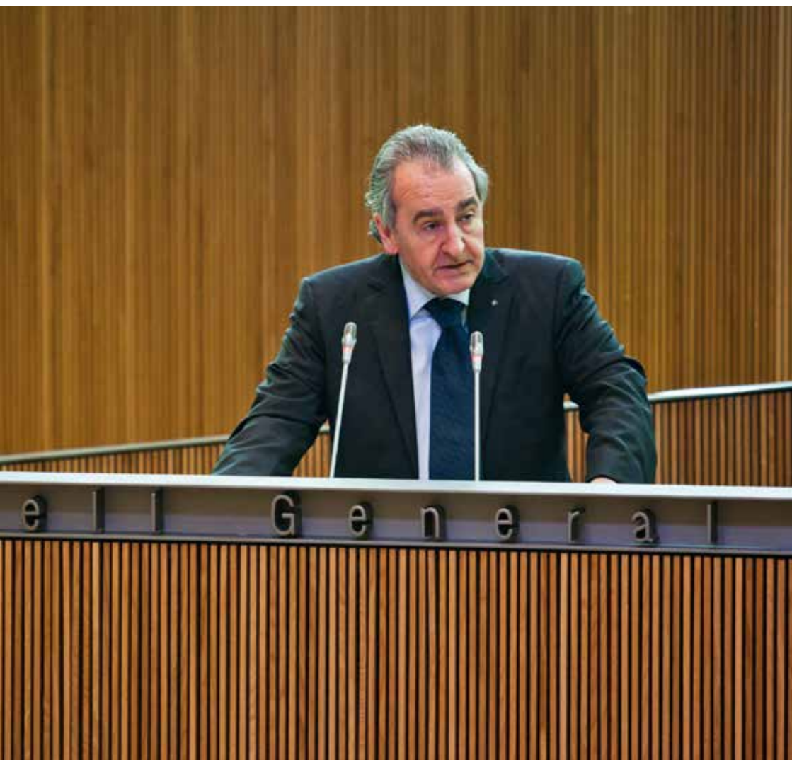
El president del Grup parlamentari mixt, Jaume Bartumeu, el dia 20 de juny durant la seva intervenció en el debat d'orientació política del 2014.